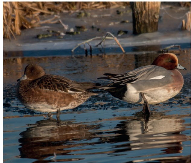
Volwassen mannetje Smient (rechts) met wit vleugelveld en een vrouwtje (links).